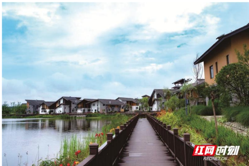
汨罗端午人家民宿旅游区。

9月17日，中秋节。当一轮圆月俯瞰大地时，汨罗市新市镇垒搭起来的“宝塔”也烧得旺起来了，火苗蹿得老高，将夜空映得格外透亮。人们围着“宝塔”欢呼，脸上挂满了笑，像汨罗江畔正放开的那一盏盏河灯，令人心生欢喜。